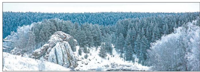
Среди получивших награды — заказник «Режевской»