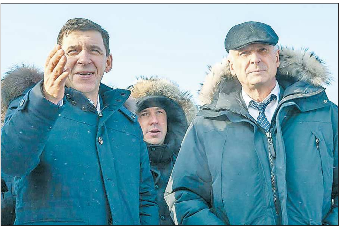
Благодаря слаженной совместной работе руководства области и города в Нижнем Тагиле реализуются амбициозные проекты

ЧЕРНОСТОЧИНСКИЙ ГИДРОУЗЕЛ. Обеспечение чистой питьевой водой остаётся одной из самых насущных проблем тагильчан. Город пьёт из двух прудов: Верхне-Бийского и Черносточинского. Наибольшее нарекание к воде, поступающей из второго питьевого источника. Свои надежды горожане связывают с комплексным планом реабилитации водохранилища, а также с концессионным соглашением, которое включает строительство современных