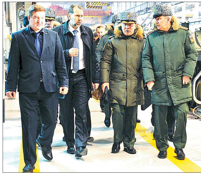
При посещении УВЗ Юрий Борисов (второй справа) сообщил о начале войсковых испытаний «Арматы»

Замминистра обороны сообщил также, что для «Арматы» готовится новое вооружение: завершаются работы над новым боекомплектом всех современных видов выстрелов для танка, включая самонаводящиеся высокоточные снаряды.