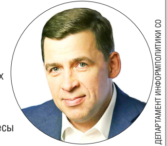
ДЕПАРТАМЕНТ ИНФОРМАТИКИ СО

Губернатор Свердловской области Евгений КУЙВАШЕВ