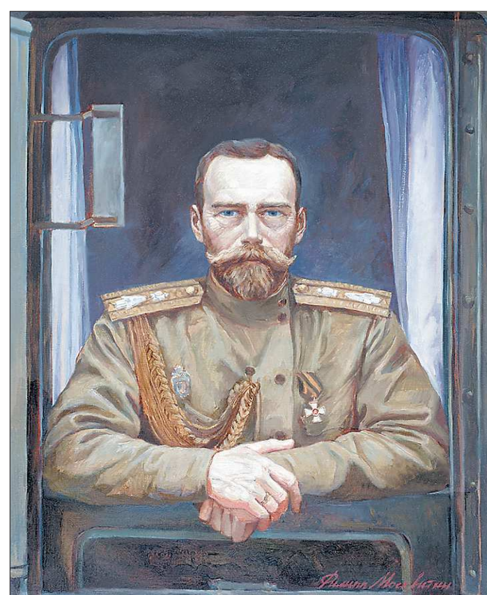
«Государь Император Николай Александрович»

В Екатеринбурге в историческом парке «Россия — моя история» открылась персональная выставка московского художника Филиппа Москвитина, посвящённая 100-летию гибели семьи последнего российского царя. Экспозиция включает более 40 полотен, которые являются своего рода срезом эпохи Николая II. Здесь представлены портреты императора, а также патриарха Тихона, святителя Иннокентия (Вениаминова), святителя Николая Японского (Касаткина), генерала Юденича, барона Врангеля, адмирала Колчака. Большую часть творчества Филиппа Москвитина занимает церковно-историческая живопись, которая по ряду причин была забыта в нашей стране на протяжении почти целого века