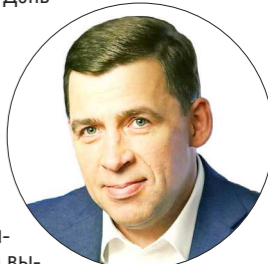
ДЕПАРТАМЕНТ ИНФОРМАЦИОННОГО СО

Губернатор Свердловской области Евгений КУЙВАШЕВ