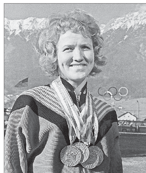
Лидия Скобликова, абсолютная чемпионка Олимпиады в Инсбруке, 1964 год

Единственная в истории конькобежного спорта шестикратная победительница Олимпиады Лидия Скобликова вчера была вовсе не на открытии Игр в Пхёнчхане, хотя там её ждали, а в Екатеринбурге, и рассказала, почему она не полетела в Корею