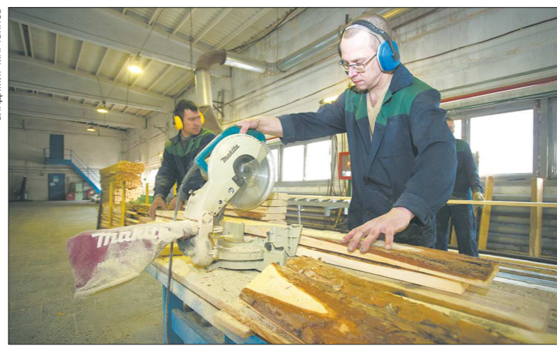
Основной продукцией компании «Лестех» являются древесностружечные плиты, доски для пола и плинтуса