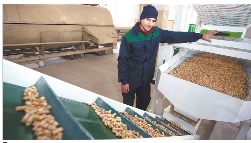
После спрессовывания пеллеты охлаждаются и отправляются в накопитель