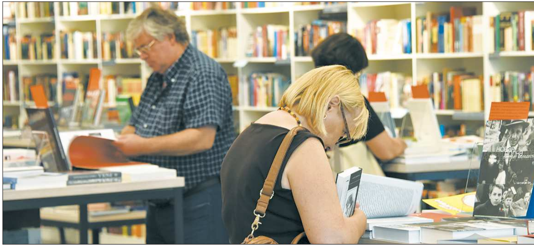
В числе самых популярных жанров у свердловчан — фантастический и исторический романы

сти сюжетно «Происхождение» напоминает по меньшей мере два отечественных романа, опубликованных в 2017 году — «Phuck 10» Виктора Пелевина и «Текст» Дмитрия Глуховского . Отсюда любопытная тенденция: у Пелевина и Брауна следствие ведёт компьютер. Но и плагиат говорить не приходится: Пелевин вышел в конце сентября, Браун — в конце октября. Скорее, речь о том, что два тонко чувствующих конъюнктура автора поняли, чего сегодня хотят читатели.