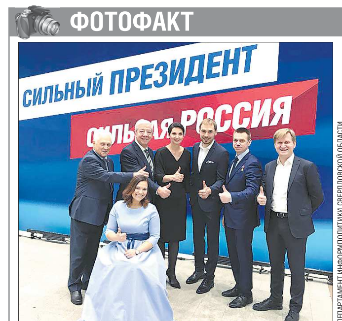
ДЕПАРТАМЕНТ ИНФОРМАЦИОННЫХ ТЕХНОЛОГИЙ СВЕРДЛОВСКОЙ ОБЛАСТИ

В ярославском городе Мышкин есть единственный в мире музей мыши, а в Полевском главной героиней музея решили сделать символ города — ящерицу