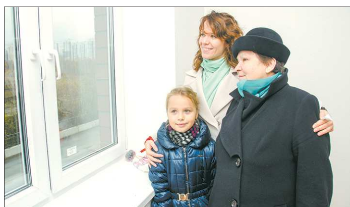
В Свердловской области в 2017 году получили свои квартиры 780 обманутых дольщиков