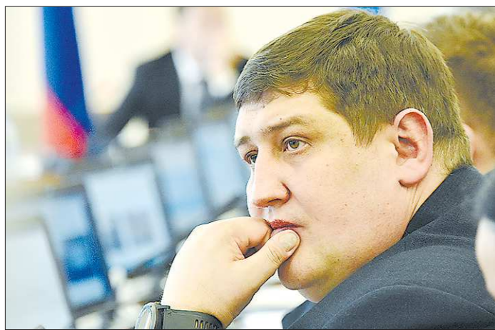
Глава миНАПК Дмитрий Дегтярёв обеспокоен: попасть в торговые сети сельхозпроизводителям сегодня непросто