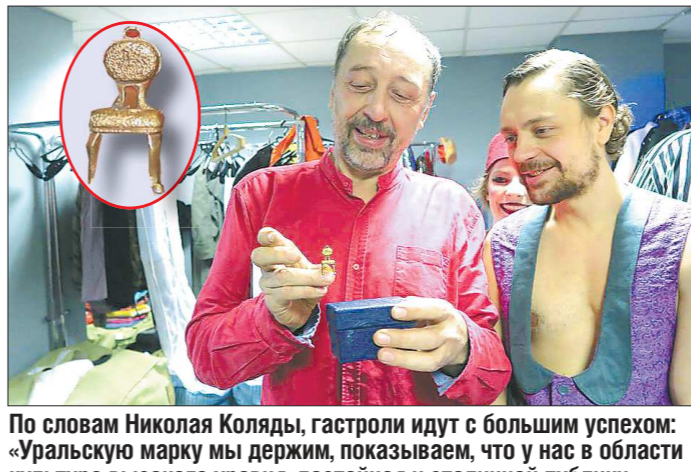
По словам Николая Коляды, гастроль идет с большим успехом: «Уральскую марку мы держим, показывая, что у нас в области культура высокого уровня, достойная и столичной публики».