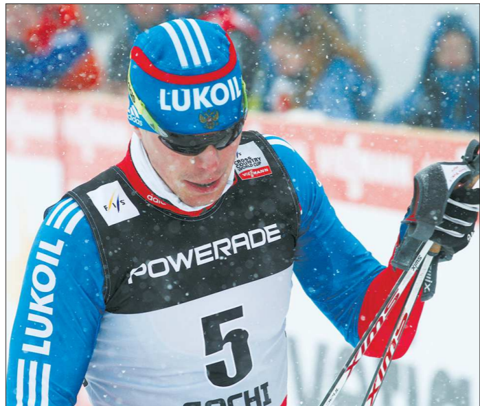
Сергей Устюгов (слева), Виктор Ан (по центру) и Антон Шипулин (справа) в своих видах спорта являются не только лидерами сборной России, но и одними из лучших в мире.