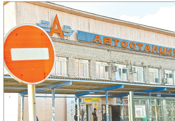
Одним из наиболее проблемных предприятий в прошлом году был МУП «Сысертское АТП». Сейчас долг почти погашен

Ещё одна громкая ситуация — долги по зарплате на муниципальных транспортных предприятиях Екатеринбурга. Тогда к главе реги-