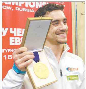
Испанец Хавьер Фернандес с шестой золотой медалью ЧЕ подряд