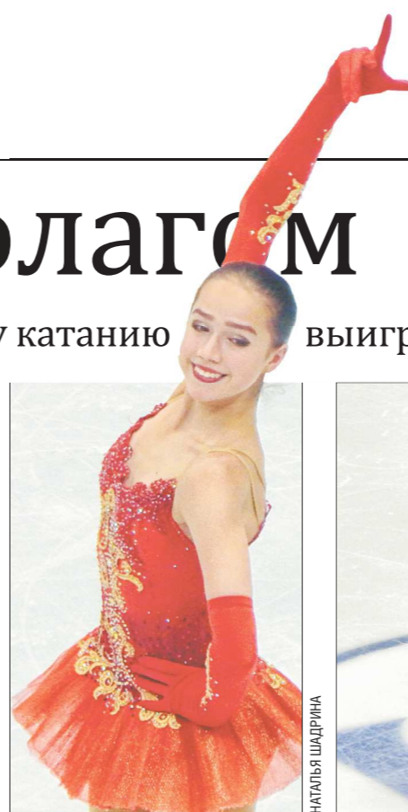
Это был первый для Алины Загитовой чемпионат Европы, и она его выиграла