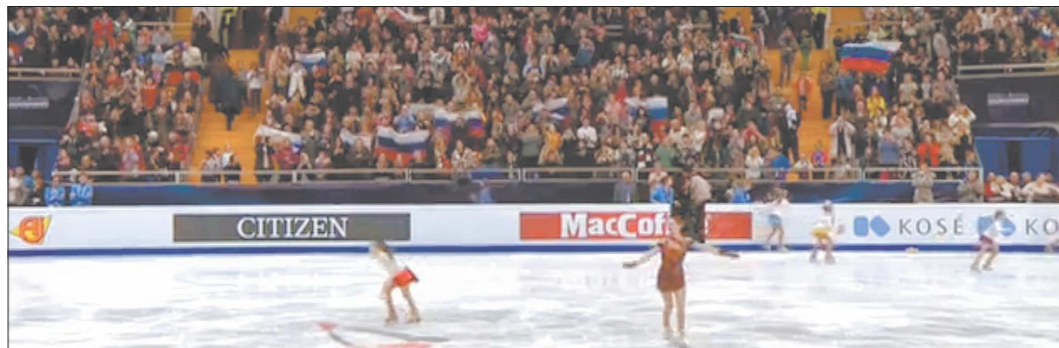
Мы не помним других соревнований, где было бы столько российских флагов, как на последних соревнованиях перед нейтральной для нас Олимпиадой