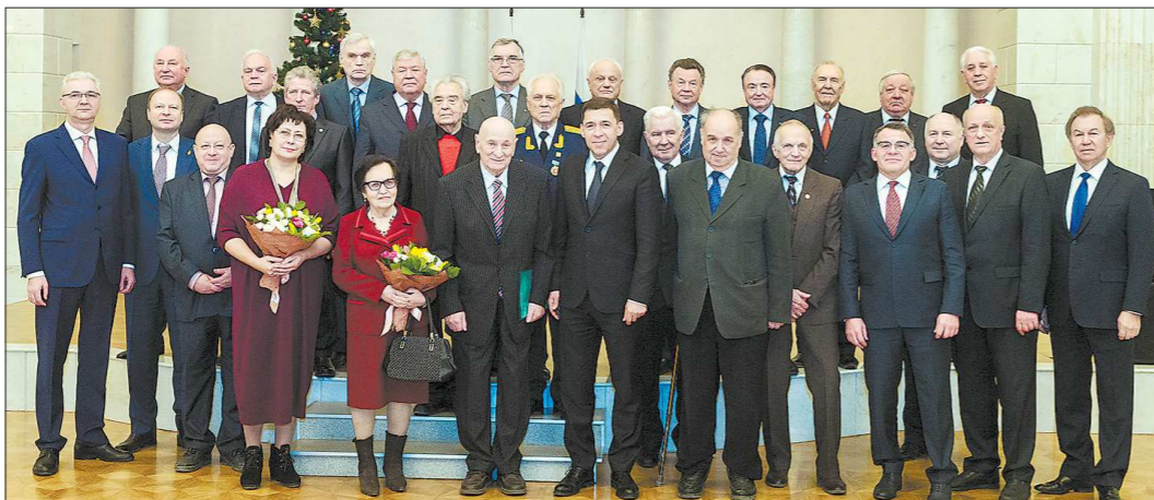
Вчера на встрече с губернатором пришли 22 почётных гражданина Свердловской области из 41 ныне живущего

Евгений Куйвашев напомнил, что в регионе стартовала программа «Пятилетка развития», «в которой почётные граждане Урала принимали деятельное участие». — Ваш опыт и глубокое знание экономики способствовало включению в программу важных проектов. Сейчас нас ждёт чемпионат мира, а вместе с ним — комплекс мероприятий по развитию спортивной и транспортной инфраструктуры. Кроме того, мы работаем над продвижением заявки на