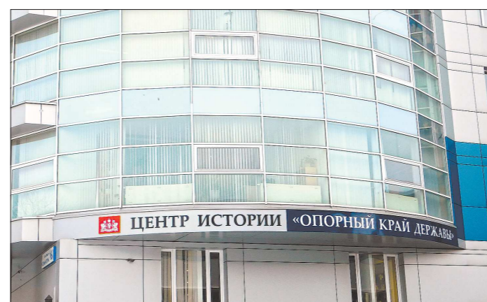
Новые экспозиции в Центре истории на улице Коминтерна, 16 можно бесплатно посетить до конца зимы

— Свердловская область была, есть и будет опорным краем державы. Поэтому мы решили, что необходимо сконцентрировать внимание именно на этом. Прежнее название суживало деятельность центра. Также в этом году мы отмечаем 75 лет со дня основания Ураль-