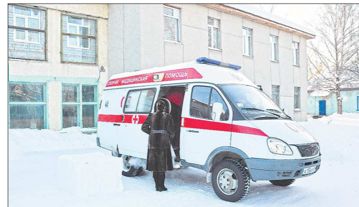
По данным ВОЗ, при тяжёлых формах инфекции, даже в случае своевременного диагностирования, 5–10 процентов пациентов умирают в течение двух суток после появления симптомов