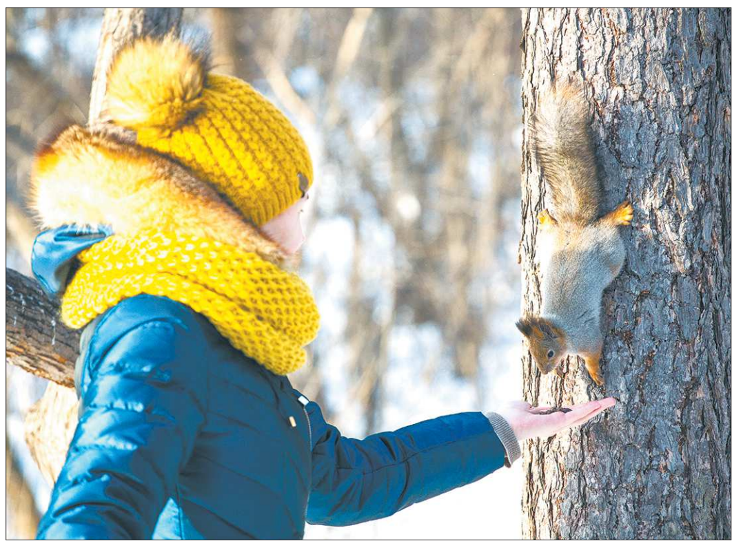
В Шарташском лесопарке много белок, которые не боятся лакомиться орешками и печеньем прямо с рук