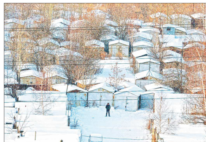
На месте не слишком эстетичного гаражного массива в квартале улиц Красных Зорь — Крауля планируется построить спортивный комплекс

— На практике примерно в большинстве гаражей машины никто не хранит, — объяснил Владимир Сикора. — Они используются для хранения ненужных вещей