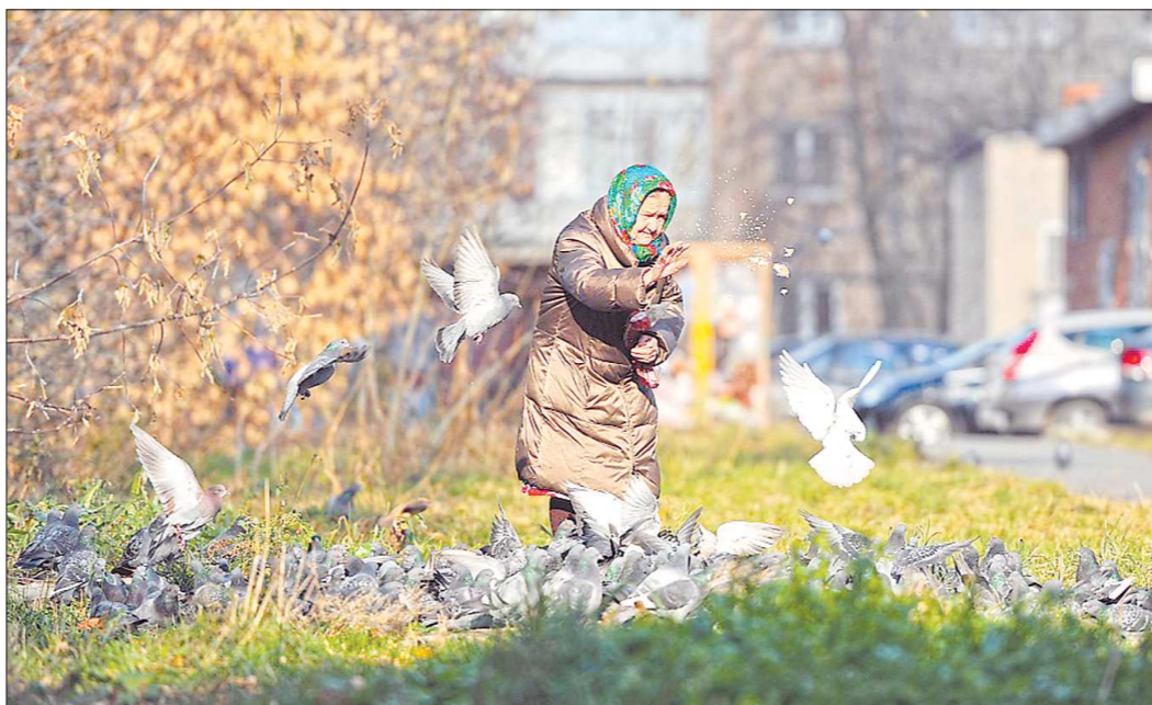
«Любовь и голуби»