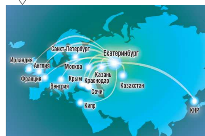
Область — более 100 командировок за год, а также в шесть городов России и 7 стран мира.