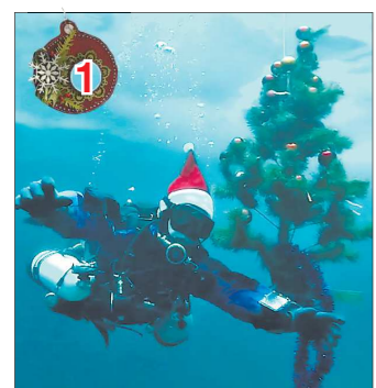
Чтобы новогодние игрушки не уплыли, их прицепили к ёлке на проволоке

Детстве многие верили, что Дедушка Мороз заглядывает в окна, но прийти он почему-то всегда мог только традиционным способом — через дверь. Первыми возвращать ребёнку веру в новогодние чудеса придумали московские предприниматели, которые одели в костюмы Дедов Морозов промышленных альпинистов. Сейчас эта услуга есть во многих крупных городах страны, в том числе и в уральской столице. Сотрудники организации, предлагающей услуги промышленного альпинизма в Екатеринбурге, в обычное время занимаются высотными монтажными работами, моют окна и фасады многоэтажек, убирают снег с крыш и крошат деревья. Но всё меняется в канун Нового года: рабочий костюм они меняют на красный тулуп и примеряют бороду.