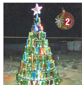
На создание ёлки ушли 274 бутылки