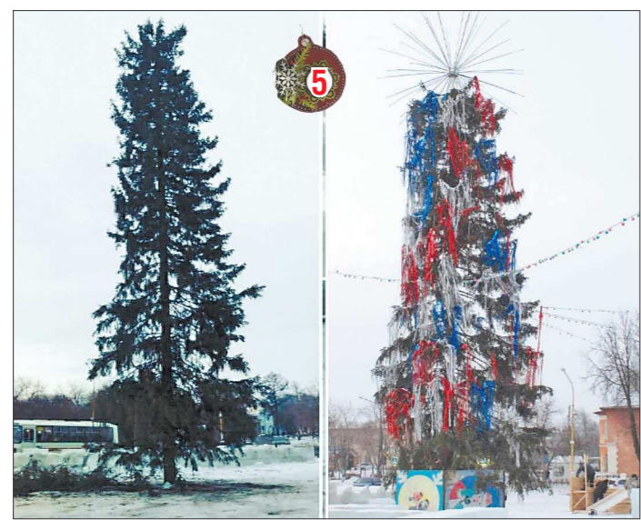
Алапаевская ёлка в этот раз не очень понравилась горожанам: лесная красавица бурно обсуждают в местных пабликах