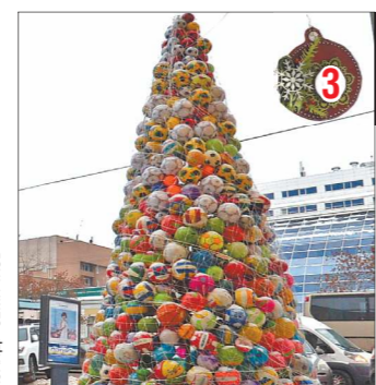
Ёлка из мячей в Екатеринбурге