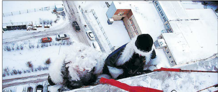
Самое сложное для Деда Мороза-альпиниста — получить доступ на крышу, с которой он будет спускаться