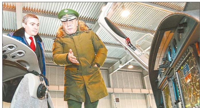
Заместитель министра обороны РФ Юрий Борисов (справа) осматривает бортовое оборудование учебно-тренировочного самолёта DA-42T, впервые разработанное и произведённое в Екатеринбурге

Уральский завод гражданской авиации (УЗГА) в 2017 году впервые за всю свою историю приступил к собственным конструкторским разработкам. Первая ласточка — бортовое оборудование для учебно-тренировочного самолёта DA-42T, посмотреть на которое вчера приехал замминистра обороны России Юрий Борисов. Планы на будущее — модернизация беспилотников «Форпост», которые хорошо себя зарекомендовали при проведении боевой операции в Сирии.