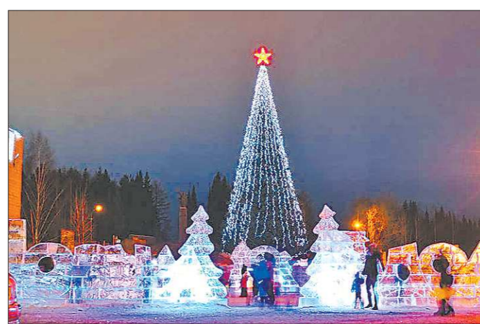
Сейчас ледовый городок — самое популярное место у жителей Нижней Туры