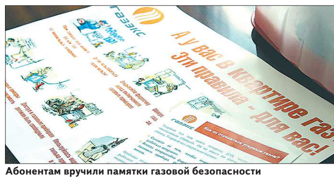
Абонентам вручили памятки газовой безопасности

Частный сектор по улице Победы для проверки был выбран неслучайно. Район газифицировали ещё в начале 90-х годов. Сейчас практически все дома оснащены газовыми котлами и водонагревателями, при неправильной эксплуатации которых в отопительный период возрастают риски отравления угарным газом. «Одно из самых распространённых нарушений, с которыми мы сталкиваемся во время рейдов, — засорённость вентканалов