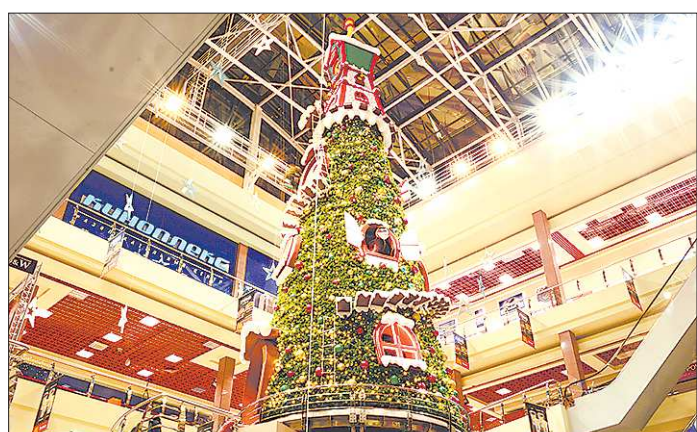
Так выглядит гигантская анимированная ель. Она вращается вместе с обитателями