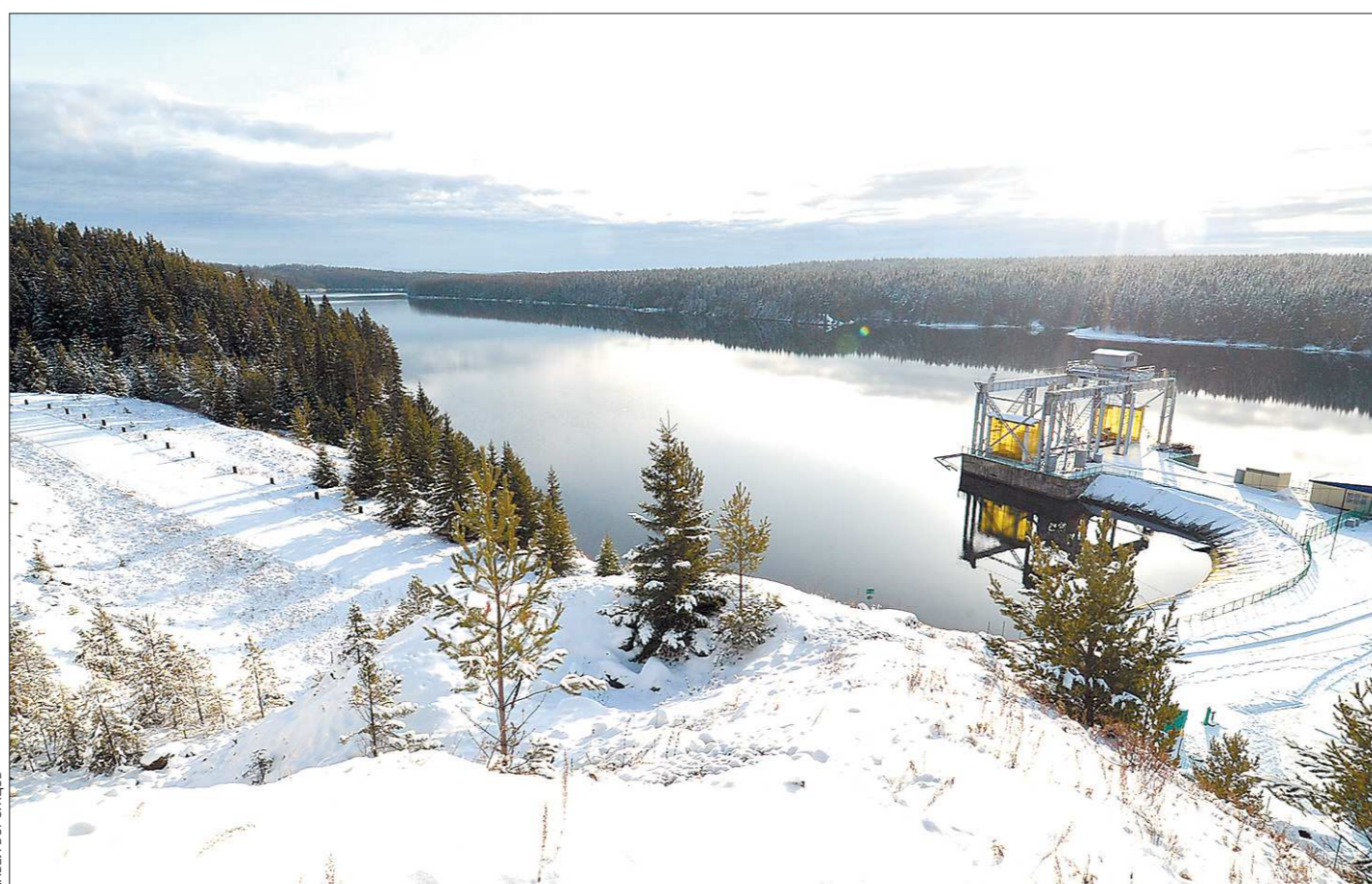
Нязепетровское водохранилище. Воду из него поднимают на высоту 400 метров и перебрасывают через Уральский хребет из Челябинской области в Свердловскую