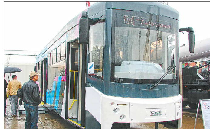
Уралтрансмаш известен не только самоходными гаубицами. В 2014-м гвоздём программы выставки на «Старателе» стал трамвайный вагон 71-407-01 с частично низким полом

● Машиностроительный завод имени Калинина (Екатеринбург) ещё с советских