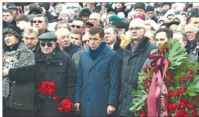
На открытии монумента: в центре, справа налево глава администрации Александр Якоб, губернатор Свердловской области Евгений Куйвашев, член областной Общественной палаты Семён Спектор