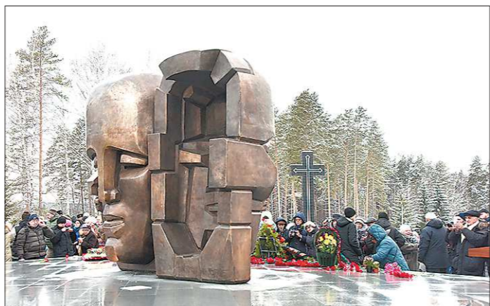
Памятник в Екатеринбурге стал второй точкой в «Треугольнике скорби»