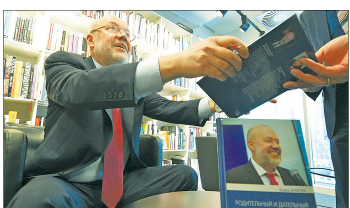
Название книги «Родительный и дательный» автор объясняет так: как герой родился и что дал

Ассоциация возникли неспроста — с подготовкой к ЧМ-2018 связано сразу несколько расходов статей областного бюджета.