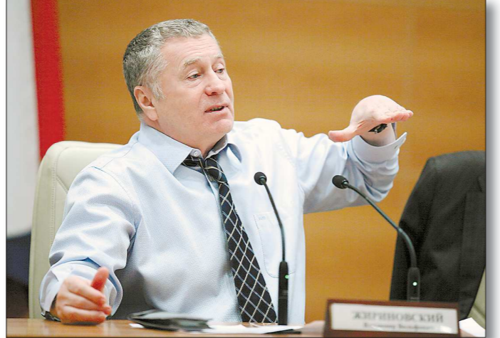
Представитель прессы ЛДПР

Неужели революционеры сами этого не понимают? На самом деле, подчёркивает Владимир Жириновский, в большинстве своём они всё понимают, а их реальные цели не настолько благородны, как они пытаются показать: «Люди совершают революцию не для того, чтобы вообще не было богатых, а для того, чтобы самим стать богаче. Не просто убраться чиновников, а занять их места».