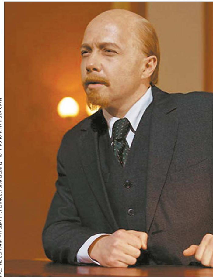
КАРЬ Ю СЕРИЯ «ТРОЦКИЙ». РЕЖИССЁР МЕССЯРЖ КИТТ. КОСТАНИН СТАСКИЙ