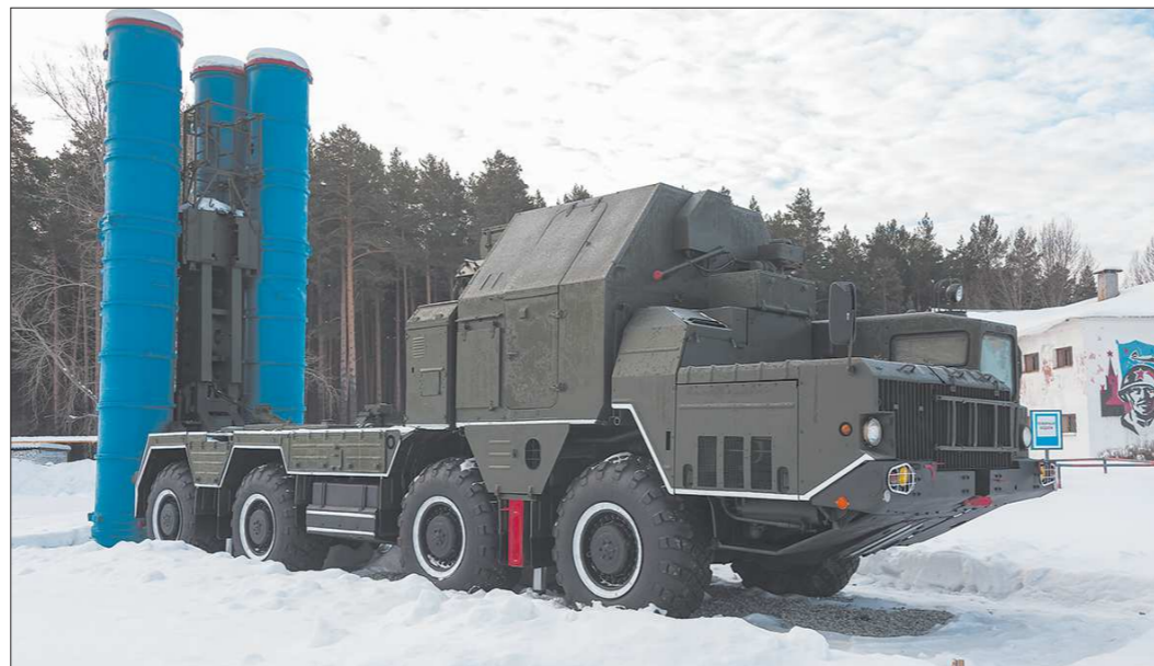
Сегодня на вооружении полка — современные ЗРК С-300 и С-400

Было это так. На второй день после взятия Зимнего дворца — 26 октября 1917 года (8 ноября по новому стилю) — глава советского пра-