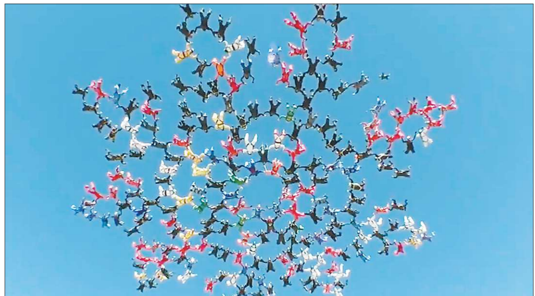
На Sequential Games сборная мира установила рекорд, создав фигуру большой формации из 217 человек с двумя перестроениями

— Ближайшая задача — установление в 2018 году ещё одного рекорда в составе сборной России. Про сборную мира пока точно не знаю. Решение будут принимать капитаны секторов. Обычно сборная мира мы прыгаем раз в два года. Так что в следующем году у нас, видимо, будет пауза. Но лично у меня уже вновь есть желание поучаствовать в очередном мировом достижении!