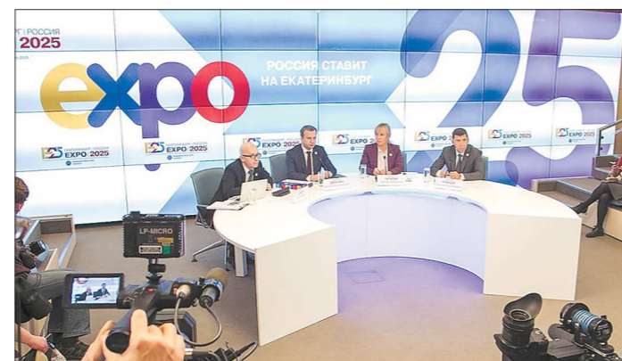
Во время телемоста с Москвой участники пресс-конференции отметили, что тема российской заявки на ЭКСПО «Преобразуя мир: инновации и лучшая жизнь — для будущих поколений» скоро получит своё развитие

— Мы будем инвестировать не столько в саму выставку, хотя это крупное событие, сколько в то, что будет существовать десятилетиями — центры инноваций, предпринимательства, образовательные и научные центры России. По нашим расчётам, за жизненный цикл это принесёт примерно пятикратную отдачу, — подытожил вице-пре-