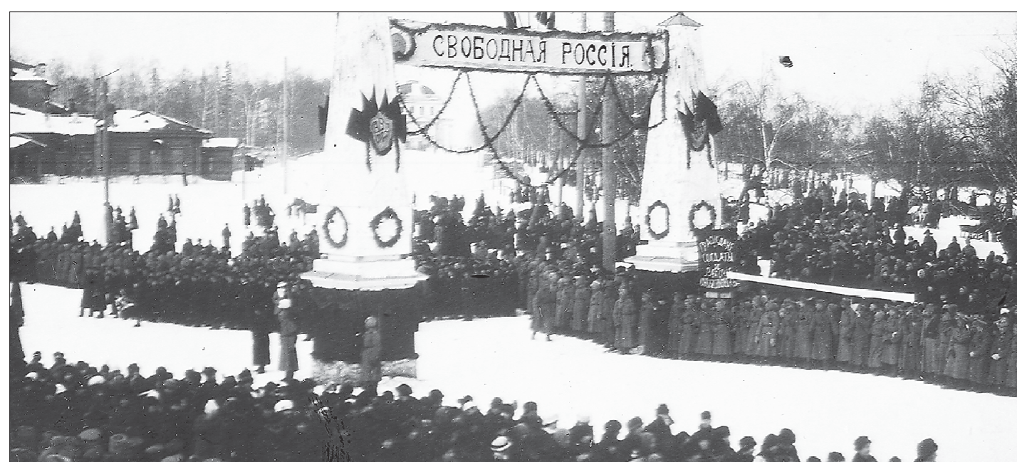
Октябрь-ноябрь 1917 года. Митинг на окраине Екатеринбурга, у Московской заставы (ныне — пересечение улицы Московской и проспекта Ленина)

на местах большевики взяли власть практически мирным путём. А при взятии Зимнего дворца погибло всего шесть человек. Идеи светлого коммунистического будущего настолько захватили людей, что они массово закладывали в капсулы обращения-наставления потомкам. А вскрыть их полагалось непременно 7 ноября 2017 года