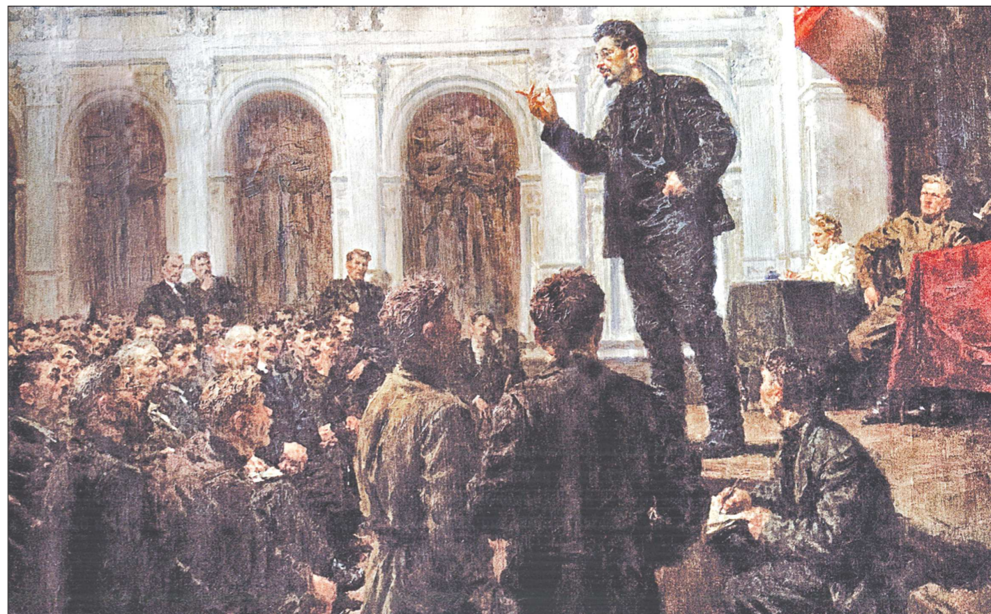
Апрель 1917 года, Екатеринбург. Яков Свердлов выступает на первой Уральской свободной партконференции местной организации РСДРП(б) в здании Общественного собрания (ныне — здание на углу улиц Карла Либкнехта и Первомайской)