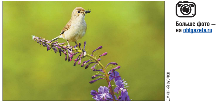
«Бормотушка на иван-чае». Снимок сделан в Екатеринбурге. Северная бормотушка — перелётная птица семейства славковых, один из видов рода пересмешек

история, которая порой даже более яркая, чем сама фотография. К примеру, добраться до тех же самых камчатских медведей в разы труднее, чем караулить удачный кадр. Оттого можно дать волю фантазии и мысленно дополнить каждый снимок и понять, что это мгновение в бесконечности, которое благодаря стараниям фотографа мы можем видеть. Экспозиция будет работать до 12 ноября.