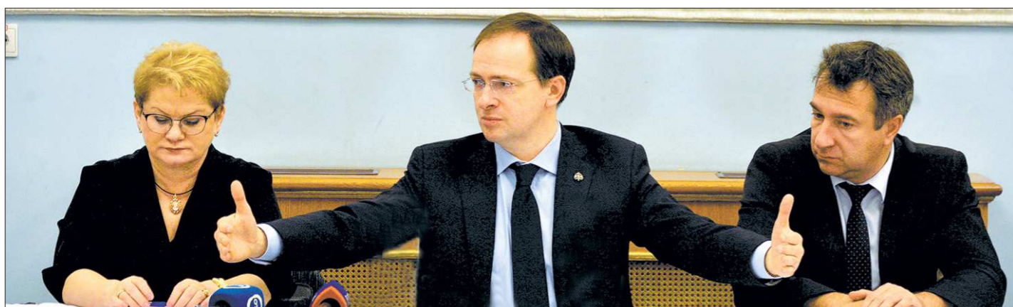
«Почётных грамот мы даём мало, но они вот такие большие. С серебряным знаком и полным набором социальных льгот»