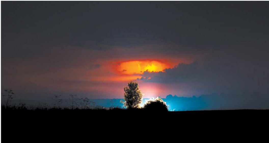
«Луч света в тёмном царстве». Фотография сделана неподалеку от Ирбита. В процессе «ловли» зарницы кусты подсвечивает фары едущего автомобиля