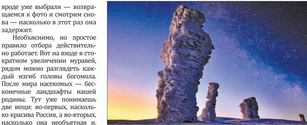
«Плато исполинов». Печоро-Ильчский государственный биосферный заповедник, скалы-останцы на горе Маньпупунёр, Республика Коми

ва Насонова — и единственного представителя области, красноярского фотографа Сергея Макурина. У него на выставке сразу две фотографии.