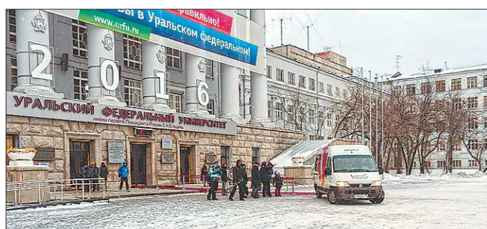
Среди вузов — членов ассоциации «Глобальные университеты» УрФУ на 10-й позиции