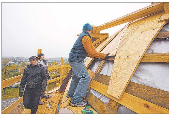
Сейчас на куполе храма идут кровельные работы