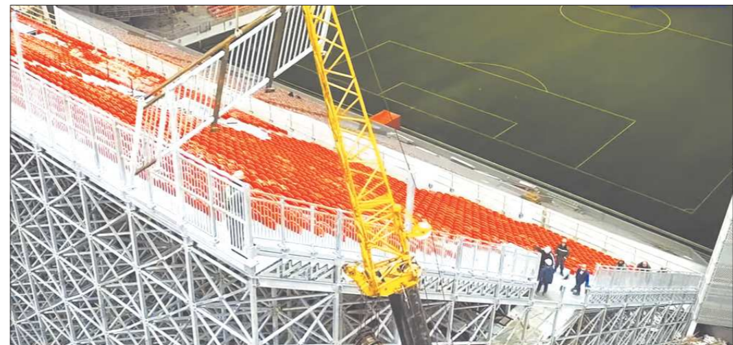
Даже с боковых мест сборно-разборных конструкций отлично видно всё футбольное поле

Но ведь если задуматься, то внешность стадиона — хоть и важная составляющая, но далеко не главная. Куда важнее комфорт и функциональность. И здесь стоит успокоить всех,