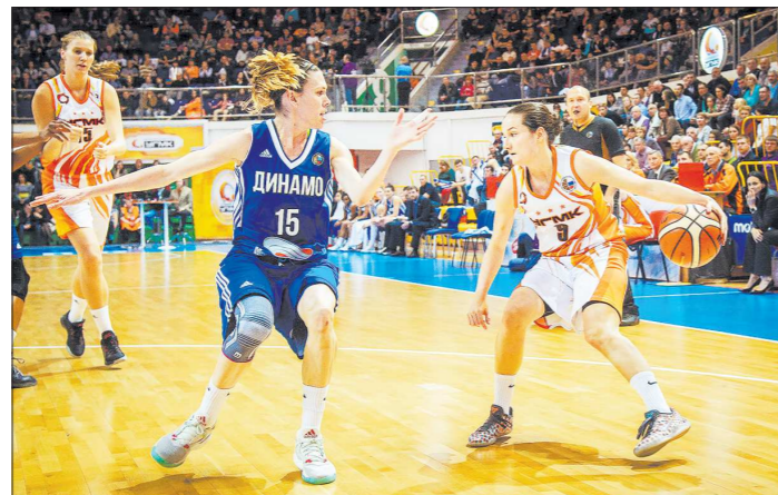
В предстоящем сезоне продолжится баскетбольное противостояние между Екатеринбургом и Курском. Предыдущее принесло победу в чемпионате России «УГМК» и золото Евролиги их соперницам

Баскетболистки «УГМК» провели первый домашний матч в рамках регулярного чемпионата России, предсказуемо разгромив ногинский «Спартак» со счётом 88:42. Но это пока только приписка, испытания на прочность для «лисиц» и их тренера ещё впереди.