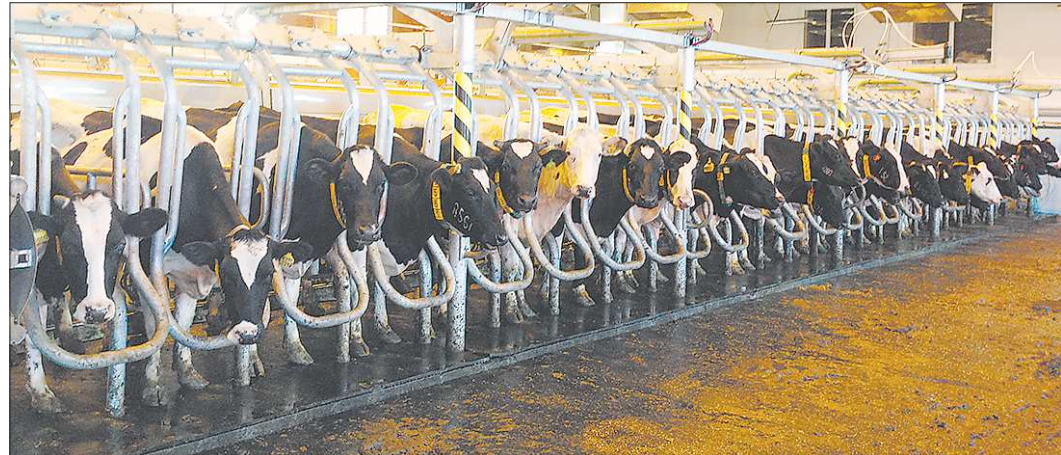
Почти 70 тонн каменского молока ежедневно передаётся молокозаводам