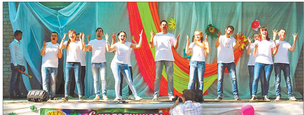
Через месяц после создания коллектив «Песня ручной работы» уже выступил на Дне молодёжи

— Песню мы выучили быстро, так как были поставлены жёсткие сроки, ведь в ближайшее время другой хоро-