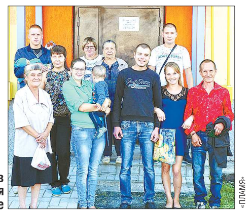
Семьи новосёлов уже обустроились в новом доме