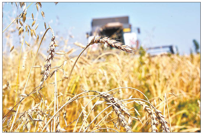
Уборка зерновых на территории области практически завершена, несмотря на внезапное ненастье

В 2017 году в России побит рекорд по урожаю зерна — уже намолочено более 122,5 миллиона тонн. Об этом заявил премьер-министр России Дмитрий Медведев на последнем заседании правительства. По данным урожая был в 1978 году — тогда это цифра составляла 127 миллионов тонн, но площадь земель под зерновыми культурами была тогда 78 миллионов гектаров, а сегодня — только 47.