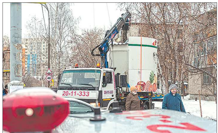
В среднем на демонтаж одного незаконно установленного киоска и хранение на складе уходит около 40 тысяч рублей