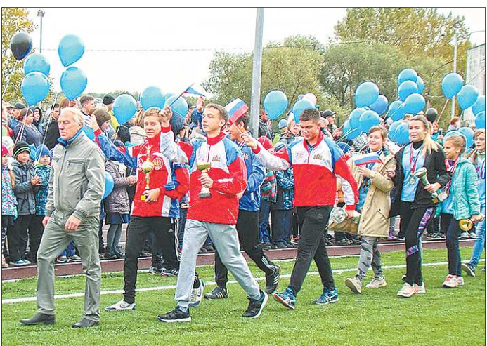
На открытии по дорожкам нового стадиона прошёл парад местных спортсменов

Сразу две новости, связанные со строительством школьного стадиона в посёлке Горноуральский, попали в федеральную повестку СМИ. Не успели ещё сдуться праздничные шарикоподшипники после торжественного открытия, как появилась информация о том, что помимо подрядчиков благоустройством стадиона занимались... школьники. «ОГ» провела собственное расследование.