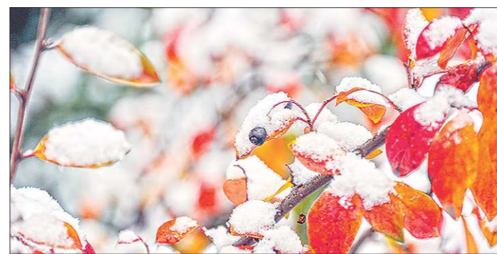
Первый снег уже выпал, а тепло появилось ещё не во всех домах региона