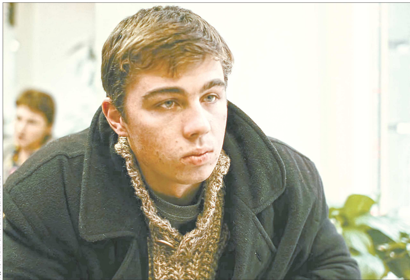
КАДР ИЗ ФИЛЬМА «БРАТ». РЕЖ. АЛЕКСЕЙ БАЛАБАНОВ

20 лет назад в фильме свердловского режиссёра главный герой задал вопрос, сохраняющий актуальность и в настоящее время