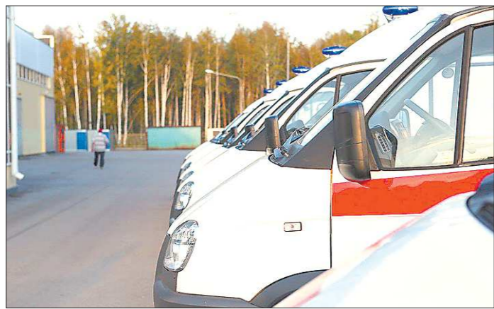
Всего начиная с 2011 года в области приобретено 294 автомобиля скорой помощи с современным портативным оборудованием