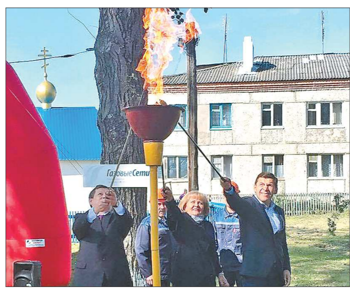
Первый факел природного газа зажгли в пышиминском селе Тупицкое. В перспективе к газопроводу смогут подключиться жители ещё семи селений

— Я — бывший милиционер, впрочем, говорят, что бывших милиционеров, а ныне — полицейских, не бывает в задержании преступника, который пытался ограбить банк. Преступник был вооружён боевой гранатой. Произшёл взрыв, после которого мне ампутировали левую руку и правую ногу... Благодаря родне, друзьям, товарищам по службе преодолел все трудности и заново встал на ноги. После протезирования и реабилитации в Уральском клиническом лечебно-реабилитационном центре стал работать во вневедомственной охране. Думаю, конгресс способствует тому, чтобы как можно больше людей узнали о высокотехнологичных протезах и других средствах, позволяющих инвалидам вести активный образ жизни.