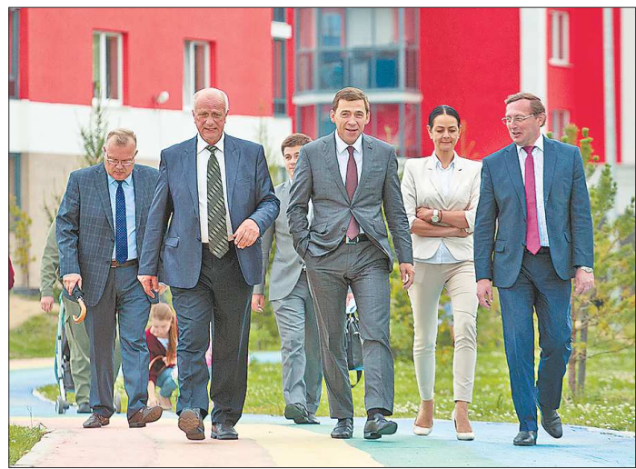
Евгений Куйвашев приехал поздравить студентов с окончанием стройки. На удивление, глава региона подпевал гимну студотрядов...