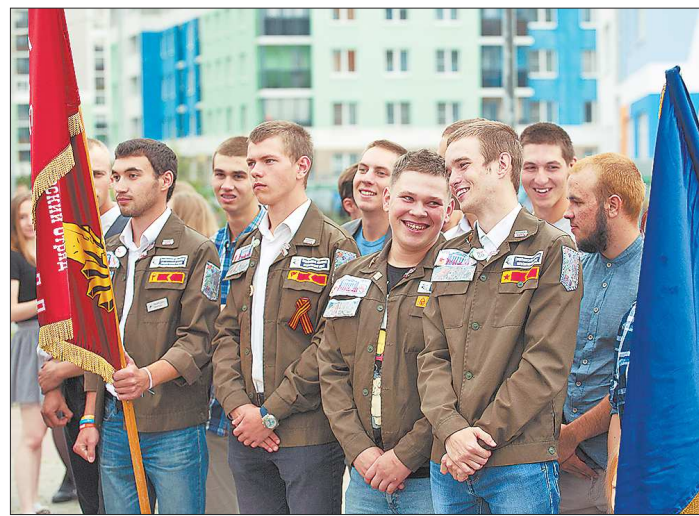
Во Всероссийской стройке «Академический» в этом году приняли участие девять студенческих строительных отрядов из вузов Екатеринбурга.