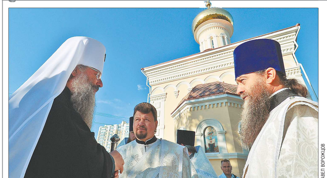
Вчера в Екатеринбурге освятили новый храм в честь Порт-Артурской иконы Божией Матери. Обряд освящения провёл митрополит Екатеринбургский и Верхотурский Кирилл. Первый камень храма был заложен в 2010 году во время визита в Екатеринбург Святейшего Патриарха Московского и всея Руси Кирилла. Церковь построена на пересечении улиц Восточная и Шевченко. Главная святая икона — копия списка чудотворной иконы Божией Матери «Порт-Артурская». По преданию, в начале XX века Богородица явилась во сне старому матросу, участнику обороны Севастополя, предупредила о грядущей русско-японской войне, велела изготовить икону и отправить её в крепость Порт-Артур, обещая покровительство в сражениях и победу русской армии. Икону изготовили в Киево-Печерской лавре, но в назначенное место доставить не смогли. Сегодня икона особо почитается в среде верующих и считается покровительницей военных и моряков, поэтому в России создано несколько храмов в её честь