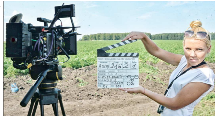
Кадр два, дубль один. Ну какие съёмки фильма без главного атрибута кино — хлопушки

— На улице стоит тридцатиградусная жара, но мы её и заказывали, — шутит Федорченко. — В кадре должна же быть