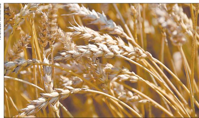
В этом году пшеница в «Каменском» даёт урожайность за 50 центнеров зерна с гектара