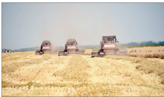
От работы комбайнов в эти дни многое зависит на зерновом поле