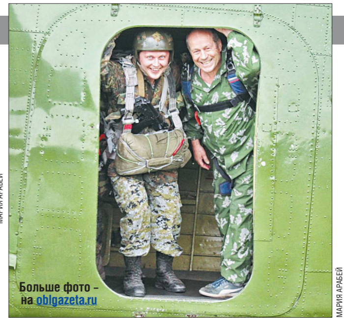
Воздушный десант за несколько минут перед массовым прыжком в дымящую завесу

Посетители фестиваля «Крылья Урала» могли подойти и поближе рассмотреть заинтересовавшие их воздушные судна