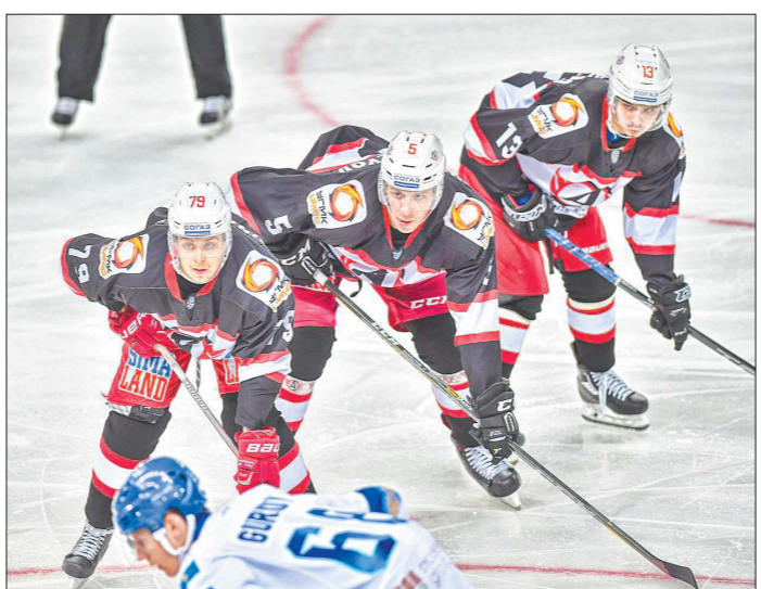
«Автомобилист» настроен решать в новом сезоне самые серьёзные задачи

что состав необходимо омолодить. Действительно, омолодили.