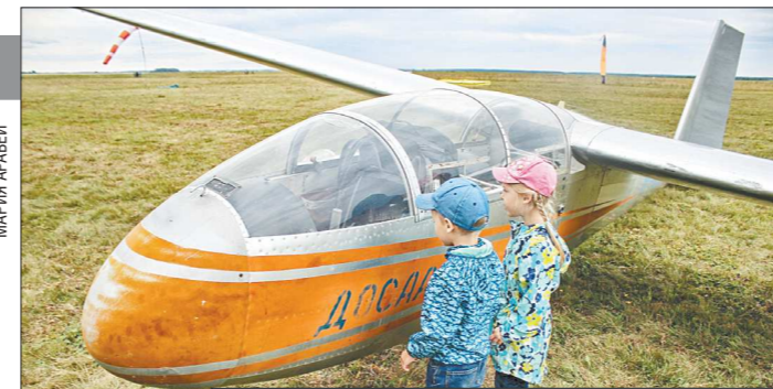
Через пару минут гость «Крыльев Урала» вместе со своим инструктором взлетит на паралёте

Посетители фестиваля «Крылья Урала» могли подойти и поближе рассмотреть заинтересовавшие их воздушные судна