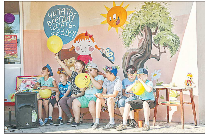
Единственное, от чего зависит работа читально-игровой площадки, это погода, которая в нынешнее лето гораздо на сюрпризы