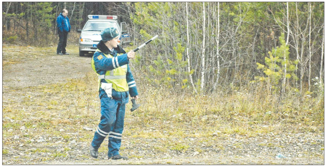
В 2017 году уголовное наказание за пьяную езду получили 14 человек