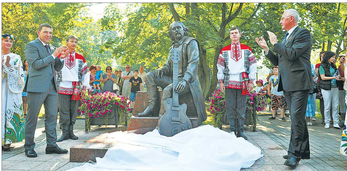
Минский памятник Владимиру Мулявину сделан из уральской бронзы и весит около 800 килограммов