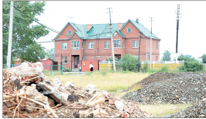
Если ваш дом зарегистрирован как надо, и вдруг выяснится, что он на территории Лесного фонда, снос ему уже не грозит

Сейчас сложилась такая система выделения земли в соб-