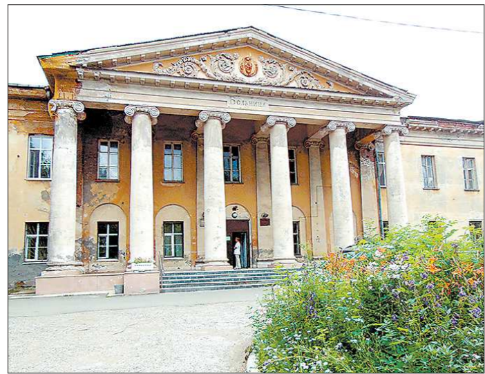
Строительство этого здания Демидовской больницы началось в 1825 году