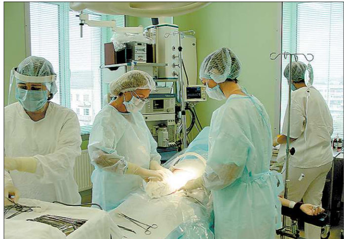
Многие профили Демидовской больницы стали монополиями в управленческом округе. Например, только здесь работают урологическое отделение, гемодиализ и отделение челюстно-лицевой хирургии

Говоря о персонале, даже в праздник главврач не может не посветовать на острый дефицит кадров. Сегодня больница готова принять на работу квалифицированных специалистов всех профилей.