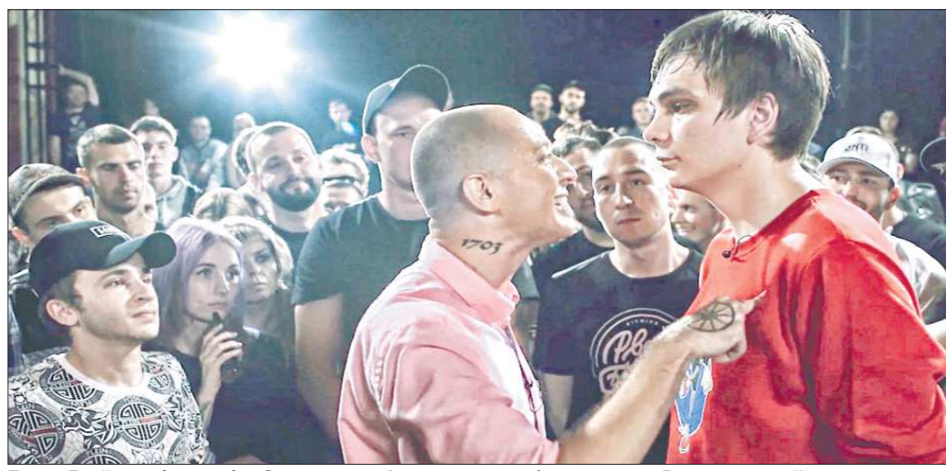
Баттл Гнойного (справа) и Оксмирона фанаты ждали больше года. Все пять судей присудили победу Гнойному

За четыре сезона Versus battle было отснято более 140 выпусков, наиболее популярная версия весь мир, или же крутящиеся спиннеры, рассматривается как нечто отклоняющееся от нормы. Что уж говорить про непонятные рэп-баттлы. Мат, унижение соперника в довольно грубой форме, оскорбления - всё это проходит под одобрительные возгласы собравшейся молодежи. И в этом, конечно, мало хорошего. Но если задуматься, то последний баттл, который и вызвал такой общественный резонанс, набрал за два дня в Интернете больше десяти мил-