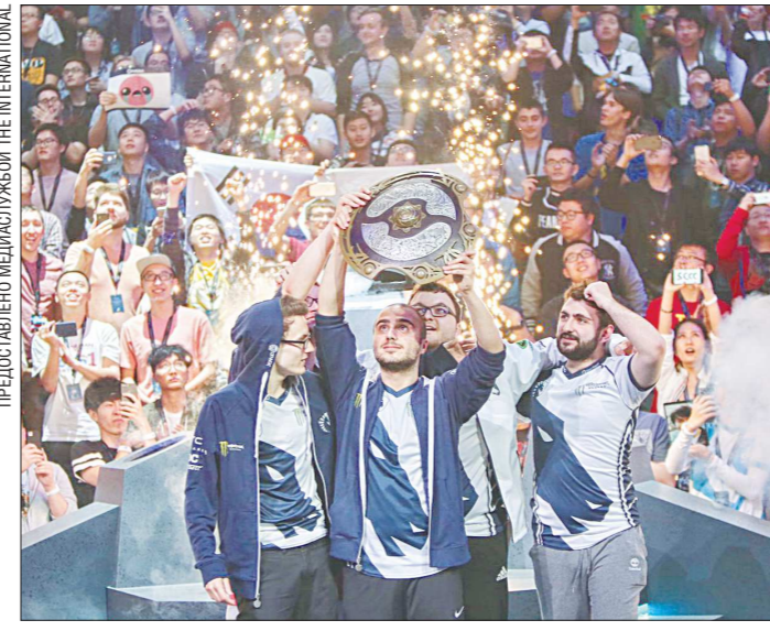
В ночь финала The International пять игроков команды Team Liquid стали долларовыми миллионерами. Призовой фонд едва ли не полностью собрали фанаты Dota 2