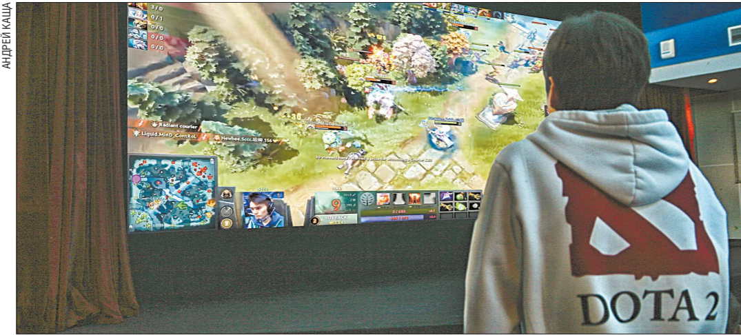
Индустрия киберспорта, построенная на фанатах компьютерных игр, показывает беспрецедентный рост: если в 2015 году выручка в киберспорте была 325 миллионов долларов США, то в 2018 году, по прогнозам, уже должна превысить 1 миллиард долларов

В минувшие выходные в Сياتле (США) завершился The International - неофициальный чемпионат мира по популярной компьютерной игре Dota 2.