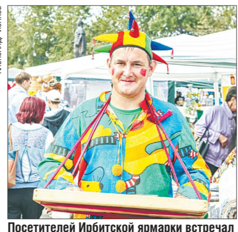
Посетителей Ирбитской ярмарки встречал и угощал разными сладостями Петрушка