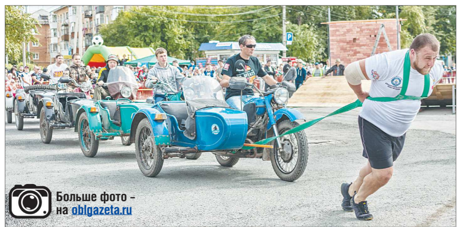
«Железных коней», которых тянули пауэрлифтеры, организаторы утяжелили зрителями