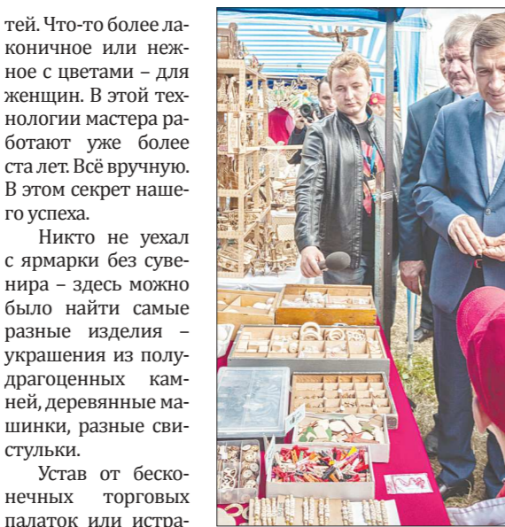
Юбилейную ярмарку посетили и глава региона Евгений Куйвашев

— Мы стараемся делать валенки яркими и более современными, — делится Юлия. — Рисунок смешариков, единорогов и смурфиков — на обуви для де-